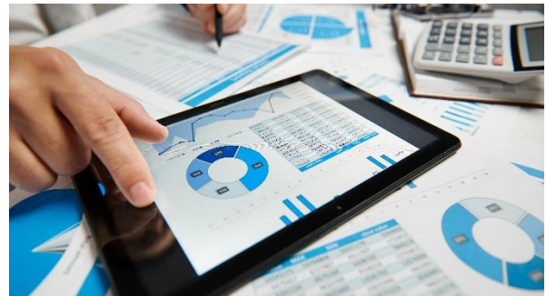
Moderne IT-Prozesse unterstützen die CxO-Strategie

Gerade moderne Anwendungen wie Office 365, Dropbox & Co. müssen in der Planung berücksichtigt werden, damit die Erwartungshaltung der Mitarbeiter (endlich) erfüllt werden kann.